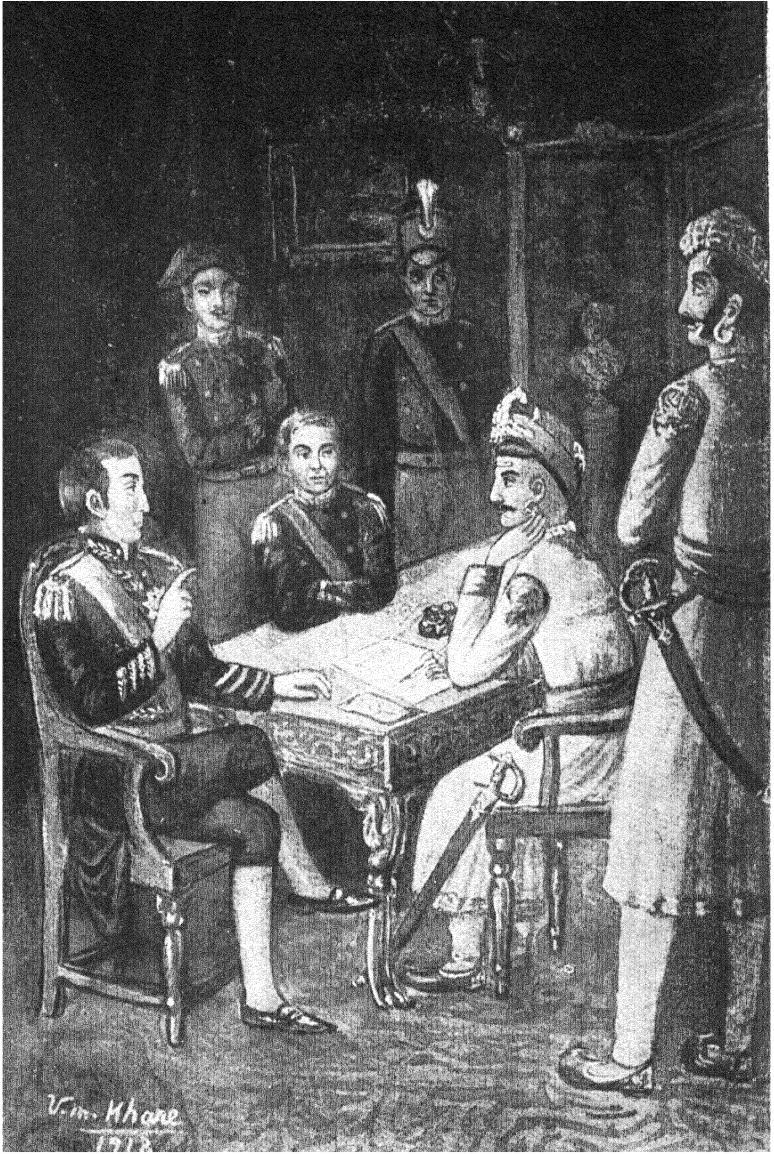
चित्रकार—वासुदेव मंहार खरे, पुणे. रावबाजी वसईच्या तहादर सही करीत आहे. (१८०२)